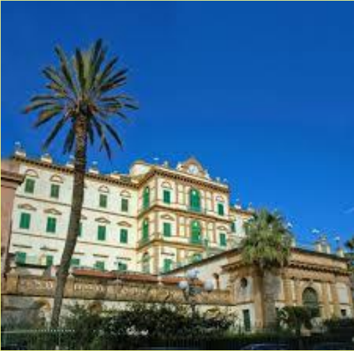
Grand Hotel Delle Terme ****

Piazza delle Terme, 2 - 90018 Termini Imerese (PA)