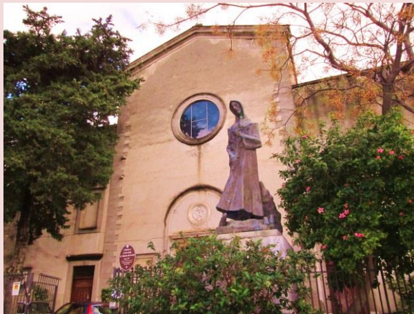
Chiesa Santa Maria di Gesù

Edificata alla fine del XV sec. nello storico quartiere Rocchecelle, sulla preesistente Torre dei Saccàri, la Chiesa ospita le Catacombe della Compagnia dei Neri (XVIII sec.). Via Sant'Orsola.