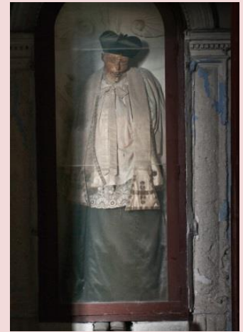
particolare: S. Baddaru

Edificata alla fine del XV sec. nello storico quartiere Rocchecelle, sulla preesistente Torre dei Saccàri, la Chiesa ospita le Catacombe della Compagnia dei Neri (XVIII sec.). Via Sant'Orsola.