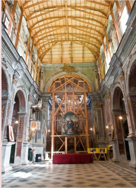
Chiesa di Sant'Orsola