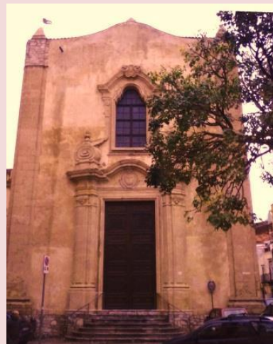
Chiesa della Santa Croce al Monte

conosciuta anche come il “ Pantheon Termitano ”.